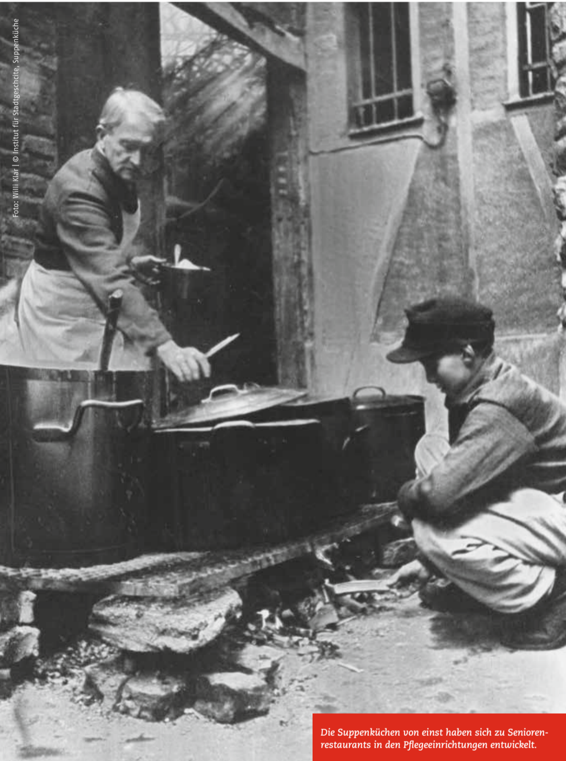
Die Suppenküchen von einst haben sich zu Seniorenrestaurants in den Pflegeeinrichtungen entwickelt.

Berlin, 13. Dezember 1919. Auf Antrag der Genossin Marie Juchacz beschließt der Parteiausschuss der SPD, eine sozialdemokratische Wohlfahrtspflege einzurichten. Die Arbeiterwohlfahrt, wie die neue Gründung genannt wird, soll den sozialpolitischen Sachverstand und die praktische Erfahrung der Arbeiterbewegung bündeln und die Wohlfahrtspolitik der Republik von Weimar aktiv mitgestalten.